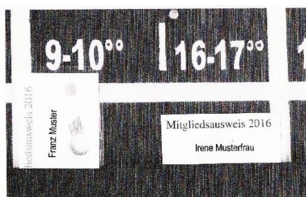
Platzreservierung für ein Einzel von 09:00 bis 10:00 oder 16:00 bis 17:00

Der erste Spieler steckt seine Karte zu Beginn der Spielstunde vertikal auf die Anfangszeit. Der zweite Spieler steckt seine Karte horizontal daneben, sodass das Ende seiner Karte das Ende der Spielstunde markiert.