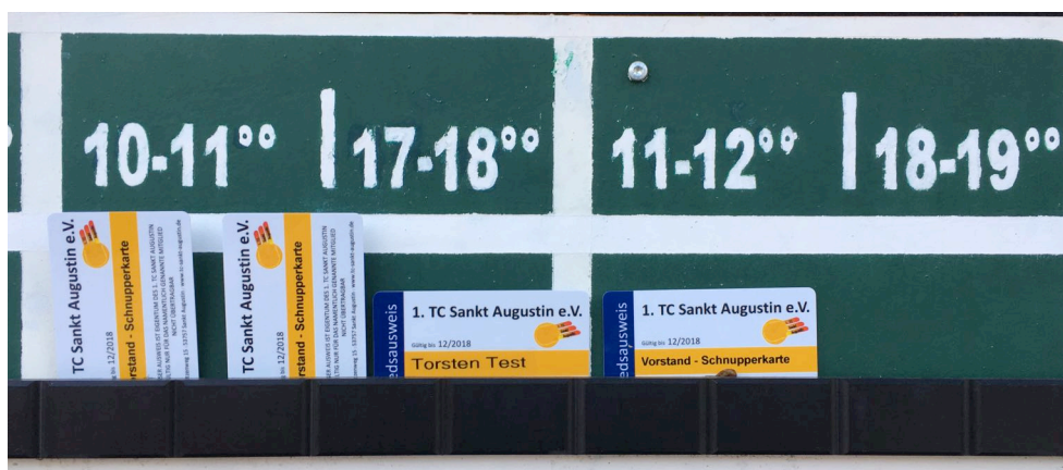
Beispiel vormittags: Spielbeginn 10:00h; Spielende 11:30h Beispiel nachmittags: Spielbeginn 17:00h; Spielende 18:30h

im Doppel werden die ersten beiden Karten vertikal und die beiden weiteren Karten horizontal daneben gesteckt: